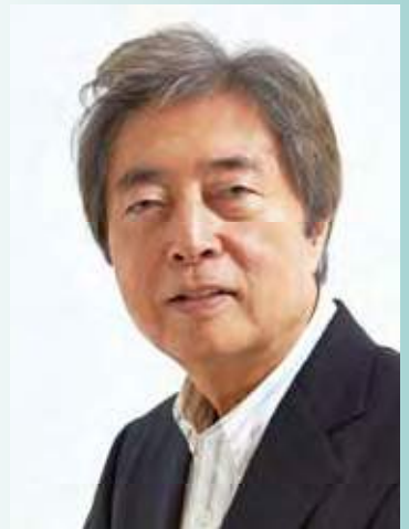
自然エネルギー推進会議 代表理事 細川 護熙氏